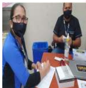
CAMPAÑA DE REALIZACIÓN DE TEST CUALITATIVO DE DETECCIÓN DE ANTICUERPOS COVID-19.

Elaboración de estudios de factibilidad y diseños definitivos de 2 puentes ubicados sobre el rio Santa Rosa: Sector Galápagos calle Eloy Alfaro y prolongación de la calle Javier Soto de la ciudad de Santa Rosa, Provincia de El Oro.