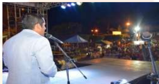
ELECCION REINA DEL CARNAVAL 2020

PLAN: REAPERTURA TURISTICA DE LA PLAYA JAMBELI TRAS 7 MESES DE CONFINAMIENTO, COMO PARTE DE LA REACTIVACION ECONOMICA TRAS LA COVID 19.