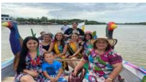
PREGON MARITIMO “MI PUERTO JELI”

“CARAVANAS TURISTICAS, ARTISTICAS Y CULTURALES EN SITIOS CON AFLUENCIA TURISTICA DEL CANTON SANTA ROSA, PROVINCIA DE EL ORO”