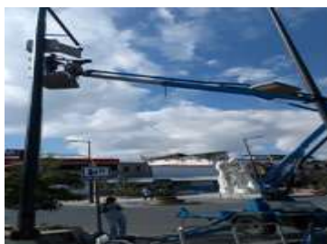
CAMARA COLON Y EL ORO (Parque de la Madre).