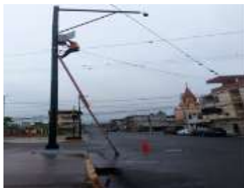
CAMARA AV. QUITO Y EDMUNDO CHIRIBOGA. (Barrio Calderón)