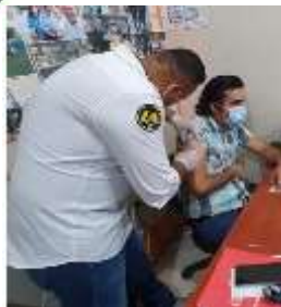
CAMPAÑA DE VACUNACIÓN PARA EVITAR EL TETANO Y DIFTERIA.