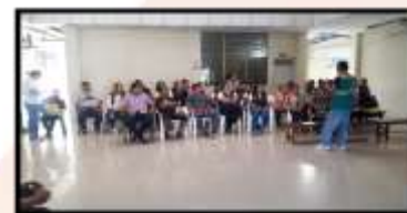
CHARLAS DE SALUD