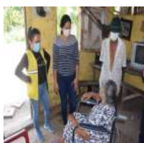
43 SILLAS DE RUEDA