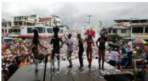
SHOW DE ESPUMA Y MUSICA EN VIVO