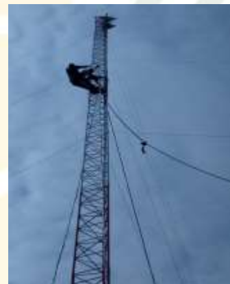
CAMARA INSTALADA EN LA ISLA HUACAS