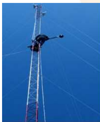
CAMARA INSTALADA EN LA ISLA CASITAS

El 13 y 14 de febrero del año 2020, se instalaron dos cámaras de video vigilancia en las islas Huacas y Casitas, entro en funcionamiento el 26 de octubre del mismo año, con señal al 100%.