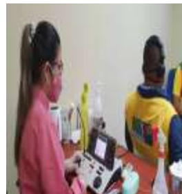
REALIZACIÓN DE AUDIOMETRIA AL PERSONAL DE RIESGO DEL GADM-SR.