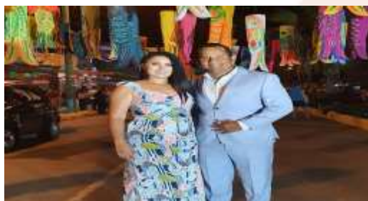
PASEO TURISTICO “PTO JELI A COLORES”