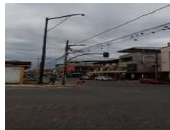
CAMARA AV. QUITO Y EDMUNDO CHIRIBOGA. (Barrio Calderón)