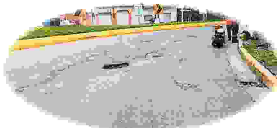
Antes ADMINISTRACION DIRECTA AÑOS DE EJECUCION: 2019

Mejoramiento de carpeta asfáltica (bacheo)